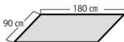
スペース小間仕様：